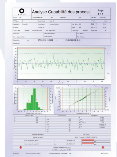
Exemple de rapport de capacité